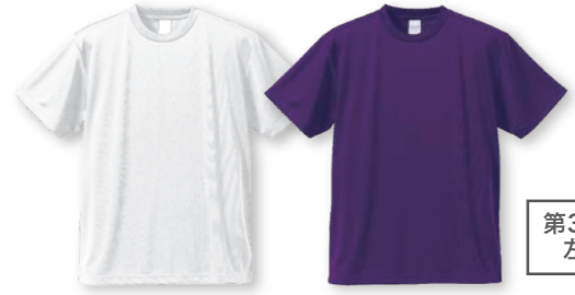
第37回大会ロゴが 左胸に入ります

今年は、白Tシャツ又は、カラーTシャツより選べます。 今回のカラーは【紺色】です。申し込み時にどちらか選択してね！ ※指定のない場合は白Tシャツとなります。